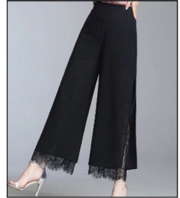
شلوار چاک دار