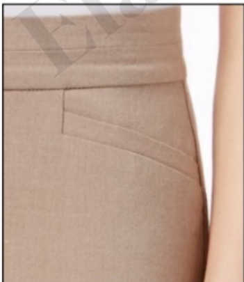
جیب اریب نقابدار