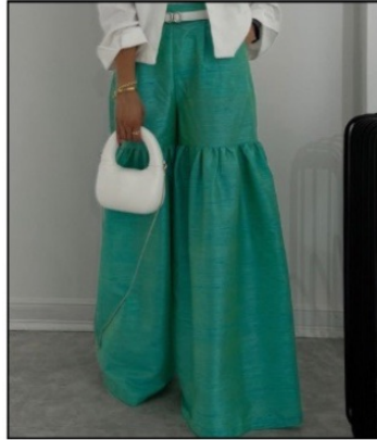
شلوار طبقه ای