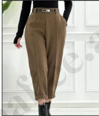
شلوار مام فیت