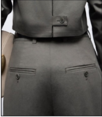
جیب دو فیلتاب