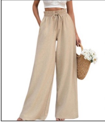
شلوار بدون درز پهلو