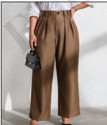
شلوار نیم بگ