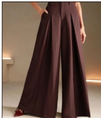
شلوار پیلی دار