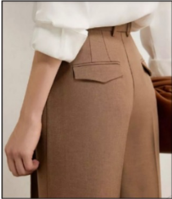
جیب دو فیلتاب نقابدار