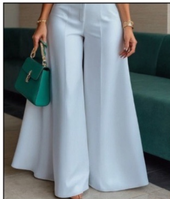
شلوار سوپر کلوش