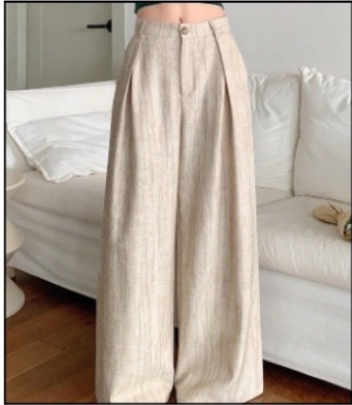
شلوار پیلی دار